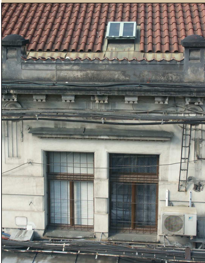
celkový pohled z exteriéru na dvě okna