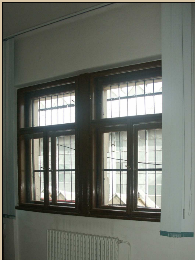
celkový pohled z interiéru