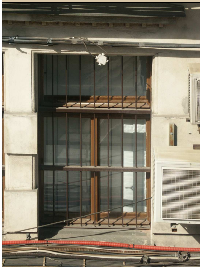
celkový pohled z exteriéru